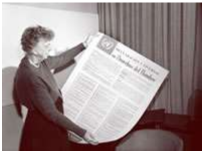
Eleanor Roosevelt, Presidente de la Comisión de Derechos Humanos para la Declaración Universal de Derechos Humanos.

A lo largo de la historia, los conflictos, ya sean guerras o levantamientos populares, se han producido a menudo como reacción a un tratamiento inhumano y a la injusticia. La Declaración de derechos inglesa de 1689, redactada después de las guerras civiles que estallaron en este país, surgió de la aspiración del pueblo a la democracia. Exactamente un siglo