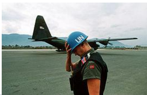
Casco azul noruego en Sarajevo .

Las Fuerzas de Paz de la ONU , popularmente conocidas como los cascos azules debido al color de los mismos, son cuerpos militares encargados de crear y mantener la paz en áreas de conflictos, monitorear y observar los procesos pacíficos y de brindar asistencia a ex combatientes en la implementación de tratados con fines pacíficos. Actúan por mandato directo del Consejo de Seguridad de la ONU y forman parte miembros de las fuerzas armadas y policiales de los países miembros integrantes de las Naciones Unidas integrando una fuerza multinacional.