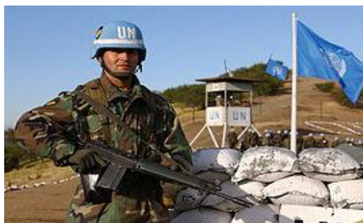
Casco azul de Bolivia en 2002, portando un SIG